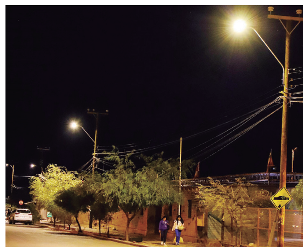
Nuevas luminarias y extensión del alumbrado público en sector terminal de buses, Pueblo Artesanos y Parque Tumisa.

Se cuentan con fondos municipales, por ejemplo, la construcción de la "Sala Radiológica San Pedro de Atacama", "Conservación Campanario de Toconao", "Reposición Párvulo E-26" de Toconao (inversión compartida con el Go-