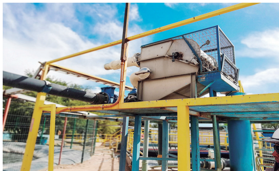
Gestión municipal y alcalde, Aliro Catur. Mejoramiento planta tratamiento aguas servidas