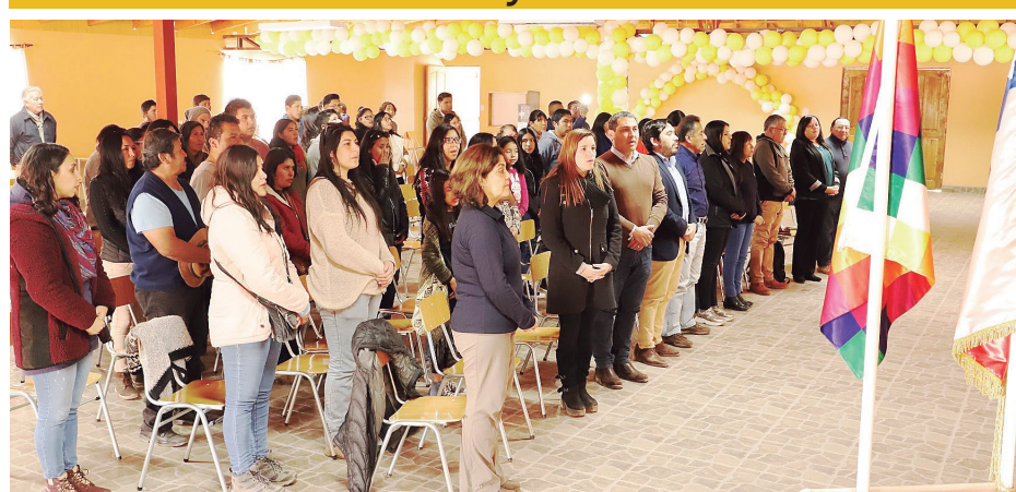
Actas de radicación y resoluciones de arriendo al comité Ckunza Lari. Soluciones habitacionales labor conjunta Municipalidad San Pedro de Atacama y Bienes Nacionales