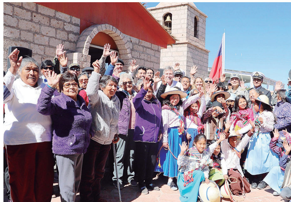
En Socaire, promoción del buen trato y vida saludable a las personas mayores con "Adulto mejor", programa de la Primera Dama. Adultos mayores atacameños junto al ministro de Defensa, delegada Primera Dama, alcalde de San Pedro de Atacama y equipo Dideco.

Catástrofes climatológicas han afectado a las familias en su integridad, hogares y economía, como las lluvias