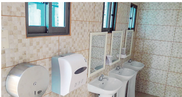
Mejoramiento servicios higiénicos escuela Peine