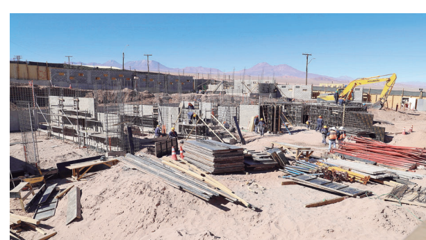
Nueva infraestructura y equipamiento del Complejo Educacional de Toconao (CET) y jardín infantil en misma localidad, con fondos sectoriales.

Sobre los establecimientos secundarios seleccionados, resultaron con alta evaluación en los factores de efectividad, superación, iniciativa, mejoramiento de las condiciones laborales, igualdad de oportunidades e integración, y participación de los integrantes de la comunidad educativa.