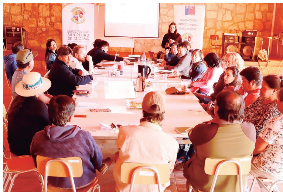
Comité Ambiental Comunal (CAC), en Peine, articulado por el municipio de San Pedro de Atacama, abriendo diálogo y construcción participativa de las políticas comunales medioambientales.

En tanto, el “Programa de Tenencia Responsable” (ley n° 21.020), aborda la responsabilidad del amo sobre las mascotas y animales de compañía, fomentando la educa-