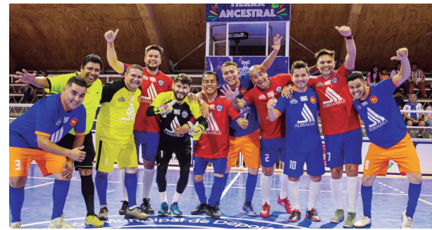
Remodelación de instalaciones gimnasio techado y sala musculación