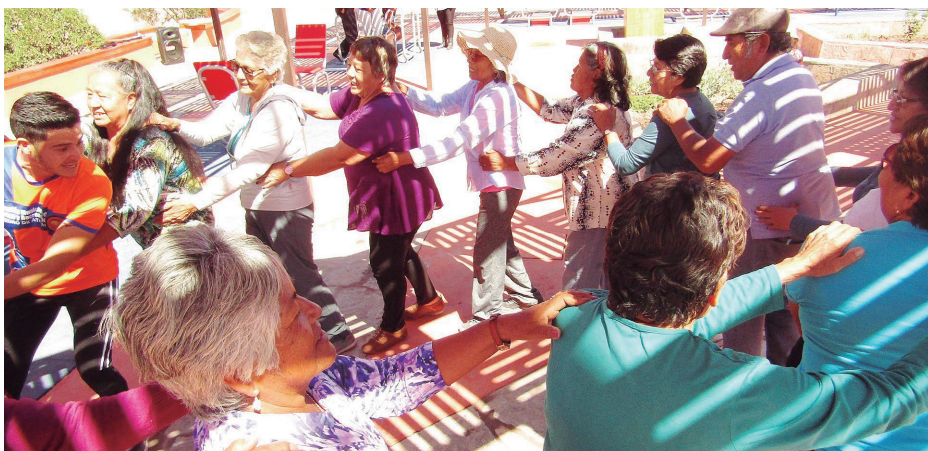
Nuevos equipamientos como plaza activa del adulto mayor que reimpulsa sector pueblo artesanos y parque Tumisa