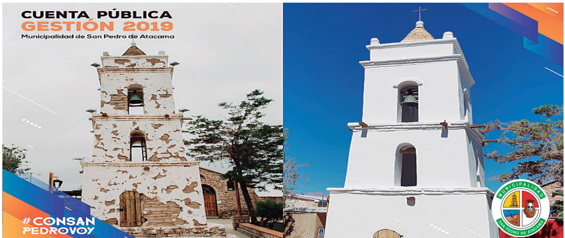
El antes y después del restaurado Campanario de Toconao que refleja los avances de la actual administración alcaldía. Conservación de la construcción Monumento Nacional (1951) tuvo participación de la comunidad toconao y religiosa.

Administración alcaldía marca liderazgo en proyectos de inversión social y en decisivo desarrollo para beneficiarios y beneficiarias.