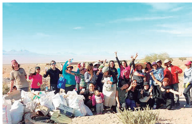
Operativo de limpieza en poblaciones Vilama, Punta de Diamante, y El Carmen; con activa participación de la comunidad.

te”, “Pago al agua”, “Día de los animales”), la participación municipal en Sipan que pone en valor el conocimiento y los productos ancestrales y tradicionales, y ejecución convenio Conaf conducente a la conservación de los ecosistemas (convenio técnico Servicio País a los agricultores de Sipan).