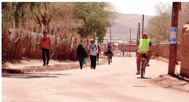
Arreglos carpeta rodado principales calles poblado San Pedro de Atacama